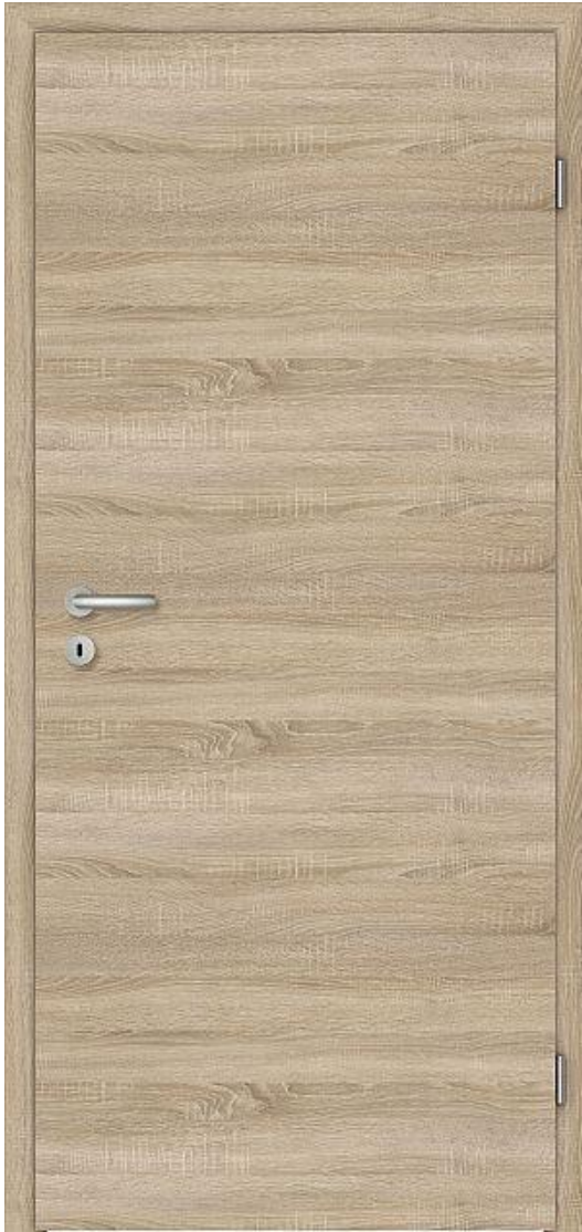
Abbildung zeigt Oberfläche Cepal Authentic Eiche für Wohnungseingangstüre und Zimmertüre. (Drückergarnitur auf Türabbildung nur Beispielhaft).