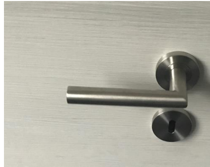
Türdrückergarnitur für Innentüren Ravenna Standard mit Rosette, Edelstahl matt